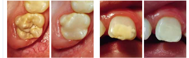
Aufbau mit adhäsiven Compositmaterialien