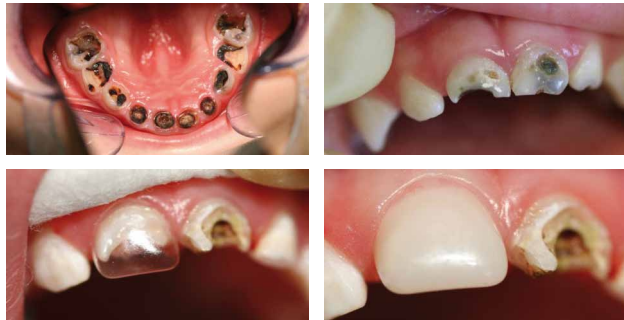
Sanierung komplexer Gebisszerstörungen.

Durch professionelle Aus- und Weiterbildung haben wir fachspezifische und umfassende Kenntnisse und langjährige Erfahrungen speziell auf dem Gebiet der Kinderzahnheilkunde.