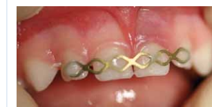
Temporäre Schienung nach Milchzahntrauma.